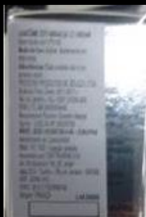
Produto sem validade

Principais tipos de embalagem não padrão: